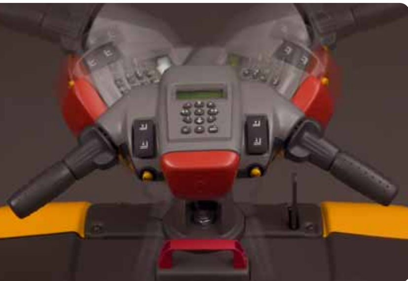
Die Lenkung von Morgen: Beim neuartigen Ergo-Handgriff von Athlet sind alle Funktionen an einem Ort vereint. Der Handgriff minimiert den Bewegungsaufwand und damit die Belastung des Fahrers.